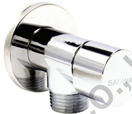
Dimension มิติ (mm.)